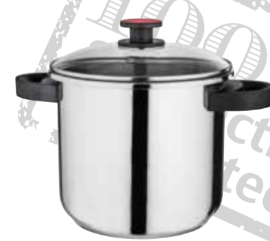
סיר בישול 4 ליטר