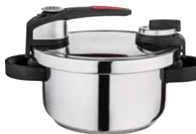
סיר לחץ 7 ליטר