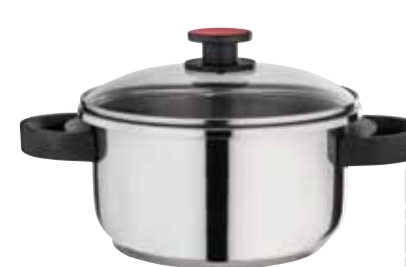
סיר בישול 4 ליטר