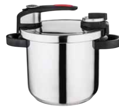
סיר לחץ 7 ליטר